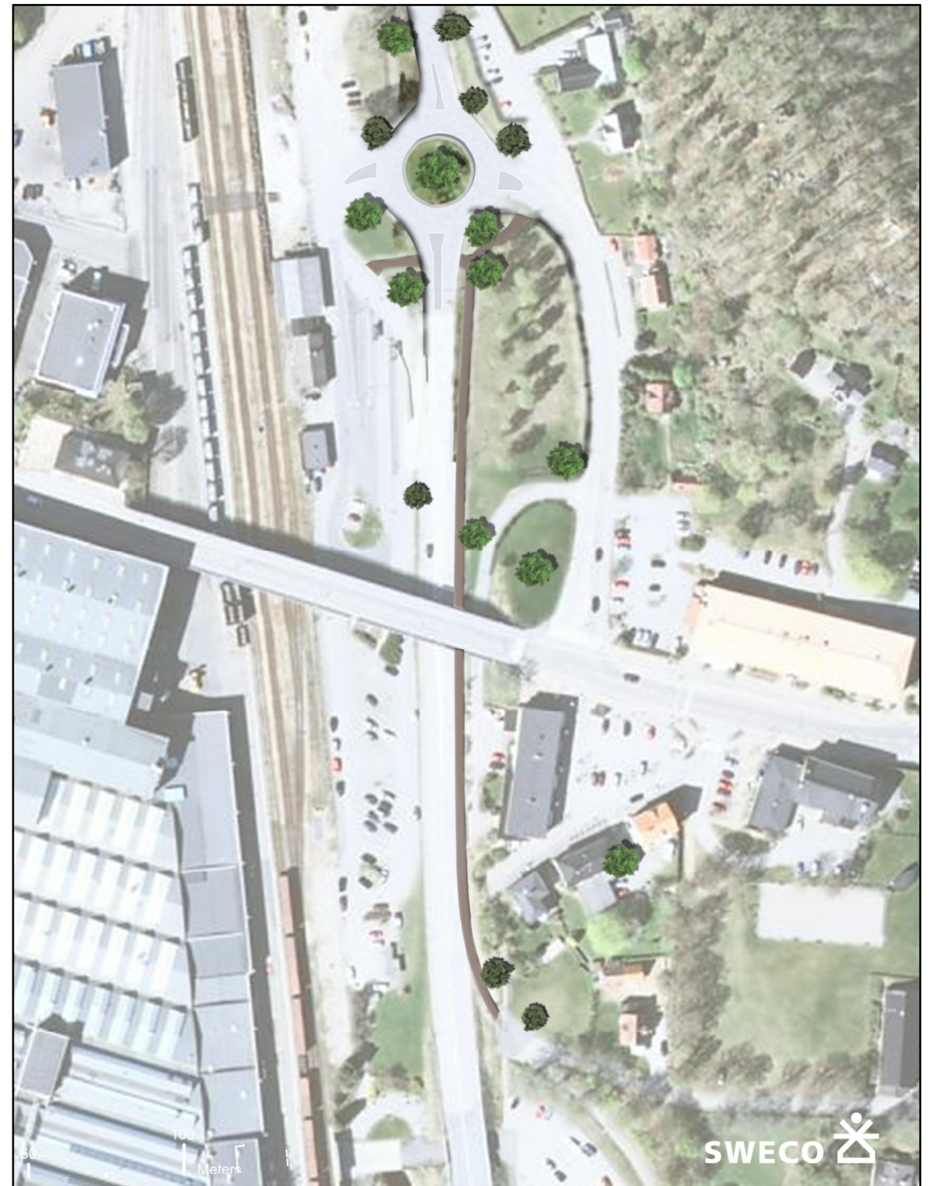
Illustrationsplan över Norra cirkulationsplatsen med gcm-väg